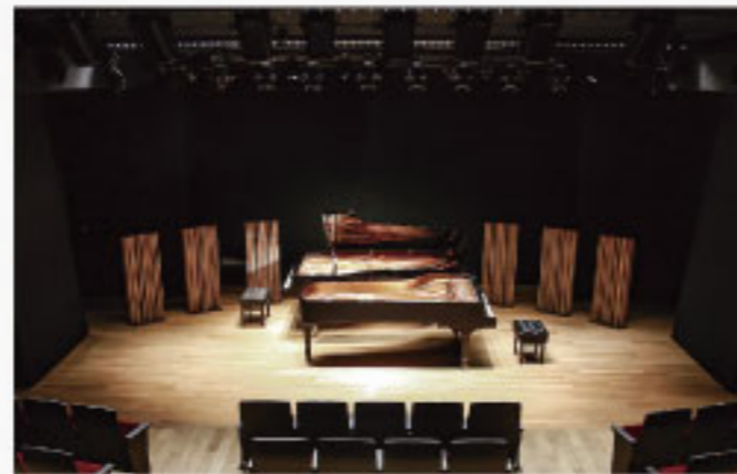
地域交流を目的とした多目的ホールとして2018年にオープン。舞台と客席の距離がライブの感動を高める180席の小ホールです。

東京藝術大学首席卒業後、南メソジスト大学メドウズ音楽院、ローザンヌ高等音楽院、国際メューン音楽アカデミーで研鑽を積み、日本音楽コンクール、ストラディヴァリウスコンクール、ブリアン国際音楽コンクール等で入賞。帰国後2011年まで札幌交響楽団のコンサートマスター。現在はヴァイタスクラルテット、サイトウキネンオーケストラメンバー。広島交響楽団首席客演コンサートマスター。